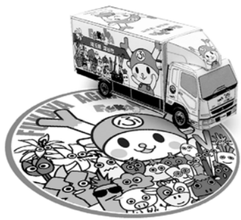
※デザインはイメージです。

応募方法 市内公共施設で配布する応募チラシ、または市ホームページの専用フォームから応募ください。 ※詳細は、市ホームページをご覧ください。