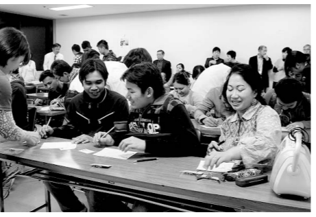
開講式には、6か国から26人の外国人のかたが参加しました

外国人のかたが快適に生活を送れるよう、今年も日本語教室を開講しました。11月まで毎週木曜日の午後7時30分から、入門・初級・中級教室が実施されます。