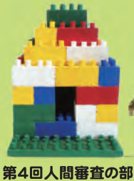
第4回人間審査の部