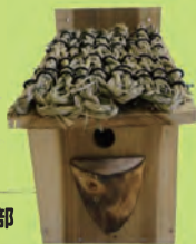
第3回鳥の審査の部