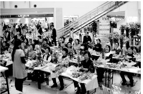
フラワーアレンジコンテスト(教室部門)には24人が参加

深谷市花き園芸組合連絡協議会により、花の展覧会が催されました。フラワーアレンジコンテストや花に関するクイズラリーなど、花と触れあうイベントが満載でした。