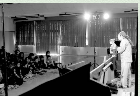
人形を操るのは劇団しらかばの皆さん

保護者の不安の解消と楽しい子育ての推進のため、講座が開催されました。今回は、おむすびころりんの人形劇が上演され、子ども達は掛け声や手拍子で参加しました。