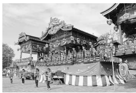
明治時代には下座で、秩父・小鹿野歌舞伎が上演されていたそうです

豪華な装飾の小前田屋台上町・中町・本町の3屋台が一同に集まりました。上町の屋台では、下座(屋台の左右に張り出した舞台)が45年ぶりに設置・披露されました。