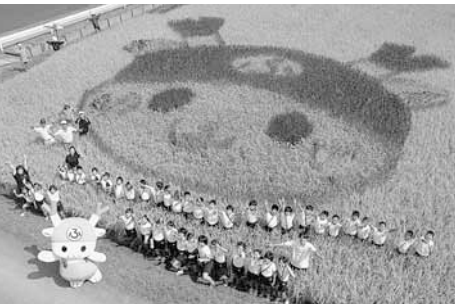
学校応援団の皆さんが、米作りの指導を行いました

川本南小学校の5年生42人が田植えをした田んぼアートが見ごろを迎え、撮影会が行われました。6種類のもち米がカラフルなふっかちゃんを浮かせました。