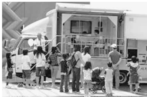
▲起震車による地震体験の様子

市では、各家庭での災害対策を考えていただく場とするため、宿泊型の避難所体験訓練を実施します。避難所生活を疑似体験することで、被災時に必要なものが見えてきます。 対象 市内在住の小学生以上 ※18歳以下は保護者同伴 ※体育館での宿泊が健康上問題ないかた とき 9月7日(金)午後5時30分～8日(土)午前8時30分 ところ 深谷ヒップタートル 内容 ①避難所体験(避難所生活を想定し宿泊) ②避難所運営(グループに分