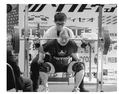
▶アジア大会の様子(昨年12月・神戸市)スクワット(バーベルを背負いひざを曲げ伸ばしする)を競技中

へ3回、世界選手権へ2回出場アジア選手権では3連覇を果たすとともに、世界選手権でも2位に入るなど、昨年からは「世界記録に最も近い男」といわれられました。 身長165cm体重73kg。その鍛え抜かれた肉体を維持するため、現在は週3日のジム通いと、毎朝腹筋400回、ベンチプレスなど1時間程度をこなします。 「わたしはまだ基礎ができていません。修正するところはたくさんあります。控えめなその言葉にも、さらなる記録更新への自信をにじませていました。」