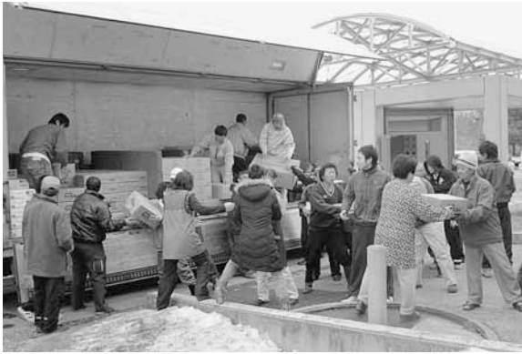
▲深谷市民からの救援物資を荷降ろしする田野畑村の皆さん