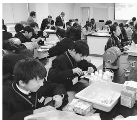
▲こころざし深谷科学塾