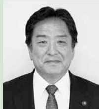
深谷市長 小島 進

深谷市長となって2年が経過しました。この間、長引く不況やそれに伴う税収不足など、市を取り巻く状況は刻一刻と変化し続けた感があります。そうした中であって、市民の皆様のご協力の下に、深谷の将来を、そして子どもたちの未来を見据え、市政を運営してまいりました。今後、厳しい財政状況が続きますが、皆様との約束を形にするよう努めてまいります。