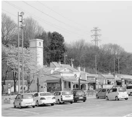
▲寄居パーキングエリア（上り線）