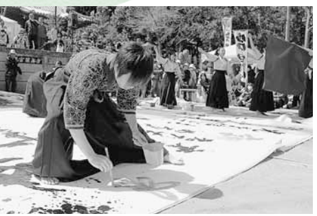
音楽とダンスと書道の融合(本庄第一高校書道部による書道パフォーマンス)

夜桜花火、桜のスイーツブース、書道パフォーマンスなど、今年は盛りだくさんのイベントを開催。7日・8日の2日間で2万人が来場し大にぎわいでした。