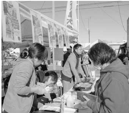
▲全国ねぎサミット 2011

「全国ねぎサミット2011」と併せて市内飲食店の協力により、市内の農畜産物を使用した特