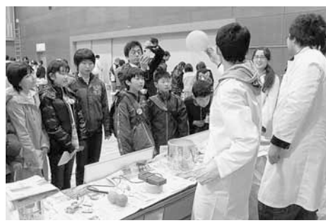
18日には、埼玉工業大学によるお楽しみ会も催されました

3月18日～20日の3日間、田野畑村の小学校5・6年生が深谷を訪れ、川本南小学校の5年生や、埼玉工業大学の学生たちと交流を図りました。