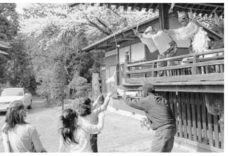
演目「御穂崎(鯛釣り)」では、恵比寿様が釣りざおの先にお菓子などを付けて振り下ろします

島護産泰神社の春の例大祭で、『岡の里神楽』が奉納されました。岡の里神楽は、江戸時代から伝わる芸能で、市の無形民俗文化財に指定されています。