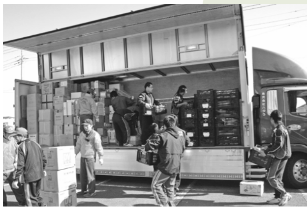
▲3月27日田野畑村への物資を積み込む深谷高校の生徒

被災地では、日々状況が変化し必要な物資も変わります。今後の状況により、救援物資などの受け付けを再開することもありますので、引き続きご協力をお願いします。