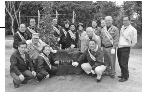
当日は14人が参加し、子どもたちへの想いを込めて植樹しました

川本ロータリークラブにより、深谷はばたき特別支援学校のグラウンド南側にハナミズキやサルスベリなどが植え付けられ、「希望の小路」と名付けられました。