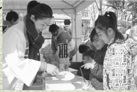
落書きせんべいを楽しむ子どもたち

今年の「ふかや桜まつり」は、震災復興支援事業として開催されました。市内を活性化するとともに、売上金は被災地への支援として、寄付されました。