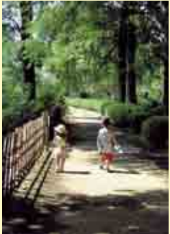
最優秀賞「夏の思い出」