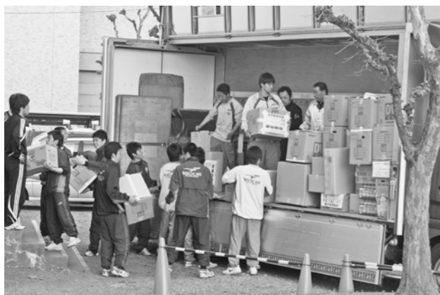
▲3月31日郡山市への物資を積み込む正智深谷高校の生徒