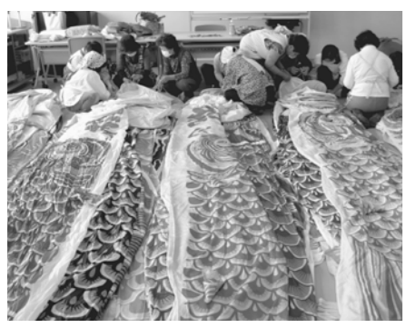
▲被災地で元気に羽ばたけ！地道な補修作業が続きます

日赤奉仕団は、市民からなるボランティア組織で、現在、団員数は466人を数えます。 災害時に、支援活動を行う一方、平常時には、防災訓練時の炊き出しや献血会場での補助な