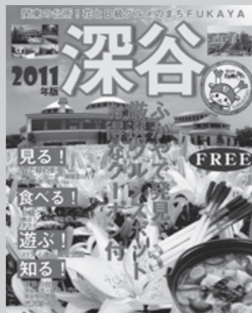
▲ PR紙の表紙の見本 (変更になる場合もあります)

24時間体制で受診可能な医療機関のご案内をしています。 電話番号 ☎ 048-824-4199 (24時間対応) ※医療相談のお応えはできません。 ※歯科・精神科の案内は行っていません。 ※案内された医療機関を受診される場合は、必ずその医療機関に電話で確認の上、出掛けてください。 ● 埼玉県医療機能情報提供システム 場所や診療科目、時間などの条件を入力すると、県内約1万か所の医療機関や薬局を検索することができます。 HP 「埼玉県医療機能情報提供システム」で検索