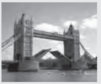
▲ロンドンの風景: Tower Bridge

I come from a small town in the southern part of England, just to the north of London, closer than Fukaya is to Omiya . It is just forty-five minutes' train ride into central London. My home town is surrounded by fields and woods. London is such an enormous city with millions of people and seems like a different planet.