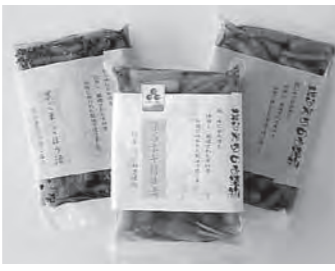
酒造メーカーや醤油メーカーとのコラボレーションによって、新たな味わいを加えたもの、積極的に開発している

小さな頃、近所には漬物屋さんがたくさんあった。醗酵食品特有の香りが此処彼処に広がっていた。しかし、その数が次第に減少していった。作れば売れる時代ではなくなっていた。