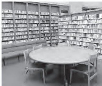
▲市立図書館で読書の世界へ...

When I was young, people used to say "I like to read a book!" Nowadays people would prefer to watch television or a DVD. But my favorite form of entertainment is a book. I don't think television is nearly as interesting as a good book.