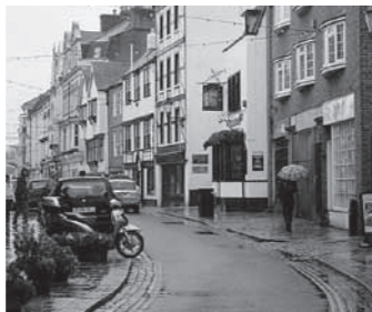
▲日中でも暗いイギリスの雨の日

I love the rain. When it starts to rain, I feel good. The world looks quite different. The British often don't take umbrellas with them. One reason, perhaps, is that the rain is not so heavy in Britain. Or the British have poor memories!