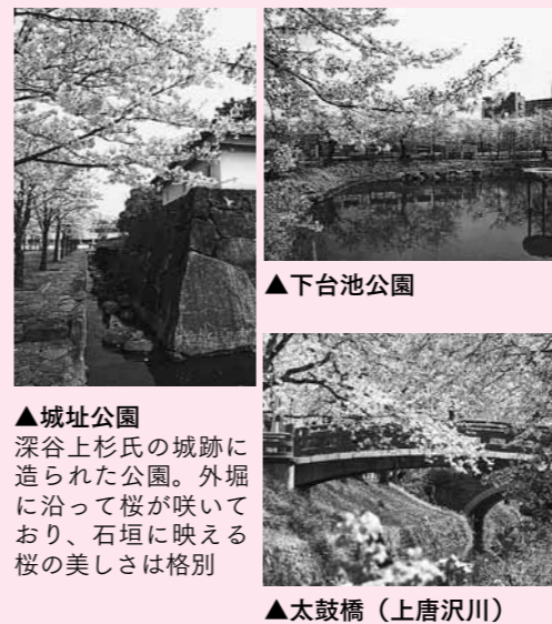
▲城址公園 深谷上杉氏の城跡に造られた公園。外堀に沿って桜が咲いており、石垣に映える桜の美しさは格別