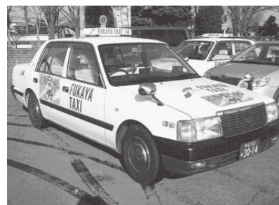
▲タクシー車両 (イメージ) くるリンのステッカーを貼って運行します。