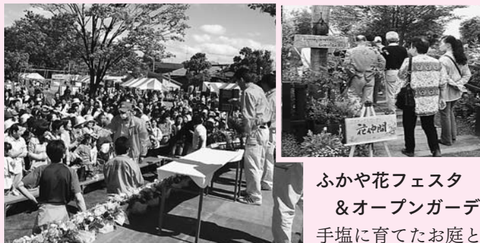
ふかや花フェスタ & オープンガーデンフェスタ 手塩に育てたお庭と好評せり市

4月25・26日の2日間にわたり開催されました。初日はあいにくの雨でしたが、オープンガーデンフェスタは81軒、緑の王国では、シンボルガーデン「深谷サステナブルガーデン」も初公開され、2日間で約40,000人の来場者が花やイベントを楽しみました。