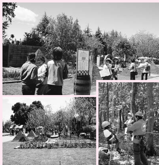
ふかや緑の王国春まつり 初公開のサステナブルガーデン とロープを使った木登り体験