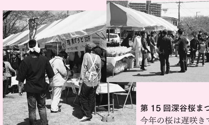
第15回深谷桜まつり 今年の桜は遅咲きでした