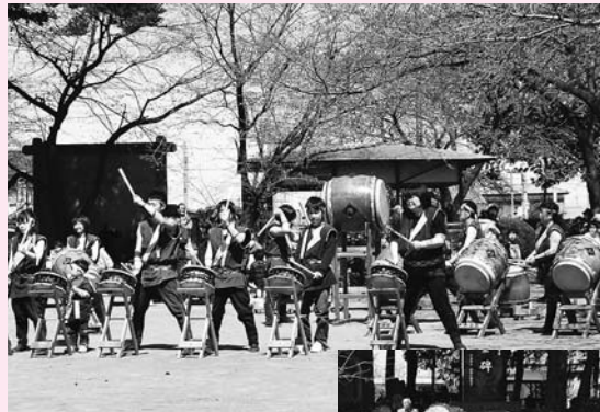
第11回重忠まつり 息もぴったり、熟練の技

同日、重忠公史跡公園で「第11回重忠まつり」が開催され、約700人の来場者が勇壮な重忠太鼓やかれんな大正琴などを楽しみました。