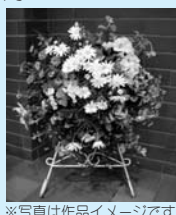
※写真は作品イメージです。