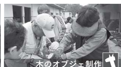
木のオブジェ制作