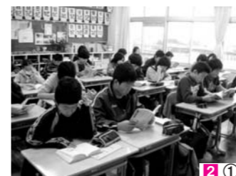
2① 全小・中学校で一斉読書が行われ、読書習慣の定着を図っています