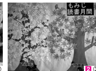
2③ 本を1冊読んだら書名や感想を葉に書いて貼っています