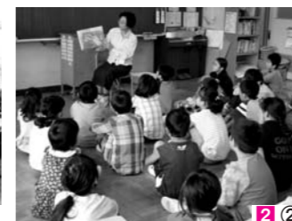
2② 定期的にボランティアによる読み聞かせを行っています