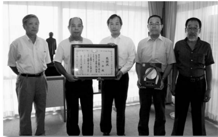
市長に報告に訪れた八会の皆さん

八会はコスモス街道や国道17号深谷バイパス沿いの植栽をはじめ、清掃・除草活動などが評価され今回の受賞となりました。