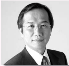
深谷市長 新井家光