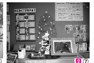
2⑦ 親しみやすい図書室にする工夫をしています