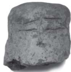
人面が描かれた土製品

説明会には、県内外から多くの見学者が訪れ、感嘆の声を上げていました。また、昨年の調査では、人面が描かれた土製品が発見されました。土製品に描かれることは珍しく、大変貴重なものです。