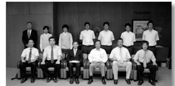
正智深谷高校の皆さん