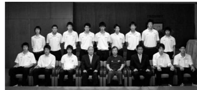
深谷高校の皆さん