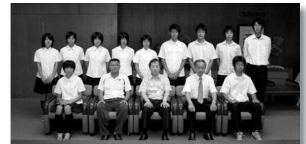
深谷商業高校の皆さん

7月15日に深谷高校男子バレーボール部、7月17日に正智深谷高校のサッカー部、男子バスケットボール部、女子卓球部、女子ゴルフ部、7月22日に深谷商業高校陸上競技部が全国高等学校総合体育大会と全国大会の出場に先立ち、市長に表敬訪問しました。