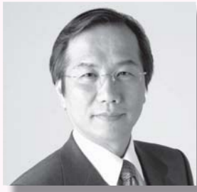
深谷市長 新井家光