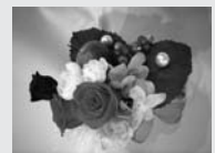
※写真は作品イメージです。