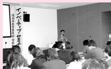
毎月、教師を対象とした講習会を開催