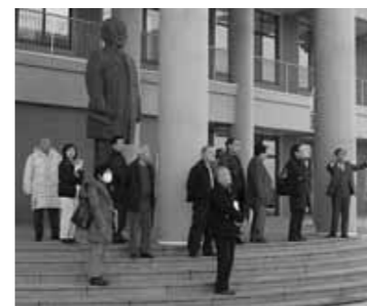
施設見学の様子(渋沢栄一記念館) 平成19年度活動から

市では、市民の皆さんからご意見をお寄せいただき、市政の参考とするとともに、市政を広くPRするため、「平成20年度市政モニター」を募集します。 あなたの声をお聞かせください! 市政モニターとは? 公募により選出された市民から、市政全般にかかわる建設的なご意見を頂き、市政に生かす制度です。 どんな活動をするの? モニター通信の提出 アンケート調査の回答 行政課題の検討 ・公共施設見学やモニター会議(4回程度) 応募資格 市内に1年以上在住の20歳以上のかた(埼玉)