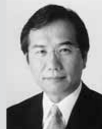
深谷市長 新井家光

深谷市総合振興計画は、時代を的確にとらえ、新たな深谷市のまちづくりを計画的に進めていくために策定したものであります。