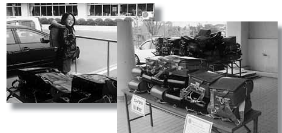
3校合わせて150個のランドセルが寄付されました

寄付されたランドセルは、主催者である「ランドセルが世界を結ぶ会」のかたたちによって、横浜の倉庫に搬入され、アフガニスタンの子どもたちの手に届けられます。