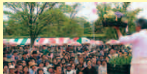
昨年の「競り市」の様子

大好評の個人の庭を公開するオープンガーデンのほか、メイン会場の深谷城址公園では、市民のガーデニング作品が多数展示される各種コンテストや、気軽に参加できる各種イベントなども企画しています。詳しい内容は、今後の広報でお知らせします。お楽しみに！