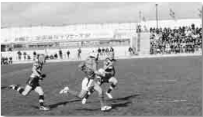
24 - 16で勝利した、対佐賀工業戦

東大阪市の近鉄花園ラグビー場で開かれた、第86回全国高校ラグビー大会に、正智深谷高校が2年ぶり11度目の出場を果たしました。シード校となった正智深谷高校は2回戦からの出場、強豪の佐賀工業高校、大阪桐蔭高校を破りベスト8まで勝ち進みました。準々決勝では神奈川県桐蔭学園高校に惜しくも破れましたが、最後まで試合をあきらめない戦いぶりに、スタンドから選手の健闘をたたえる拍手が鳴り響きました。