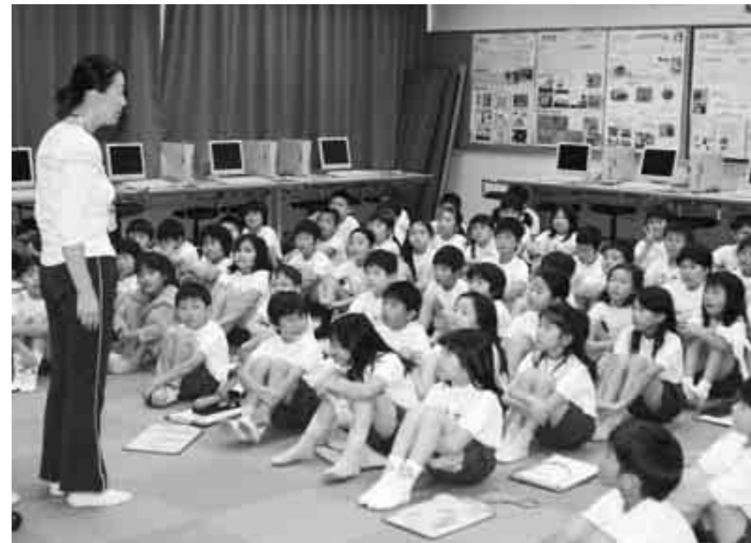
深谷小学校でのユニバーサルデザインの学習風景

まちづくりの基本姿勢は、まごころと思いやり それをかたちにするのがユニバーサルデザイン!!