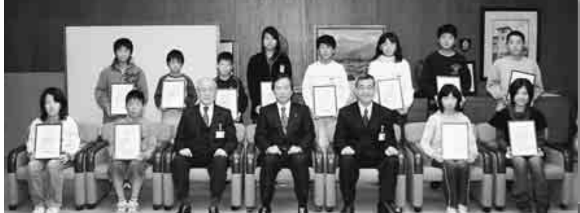
受賞された小・中学生の皆さん