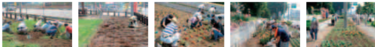
伸びてしまった草の刈り取り作業 肥料をまいて、花植え準備完了 植え込み作業開始。一株づつ丁寧に植え込みます 花は、サルビア・ポーチュラカ・ペゴニアです 植え込み終了。お疲れさまでした

大勢の来客でにぎわう「道の駅はなぞ」周辺の花壇に、地元の各種団体のかたがたと市民ガーデニングボランティアの共同作業で、花を植え込みました。 作業は二日間行われ、一日目は、除草などの植え込み準備、二日目に花苗の植え込みを行いました。夏の日差しが照り付ける暑い日でしたが、大勢のかたがたの参加により、スムーズに作業が進みきれいな花壇が出来上がりました。 お近くにお出掛けの際は、ぜひご覧ください。