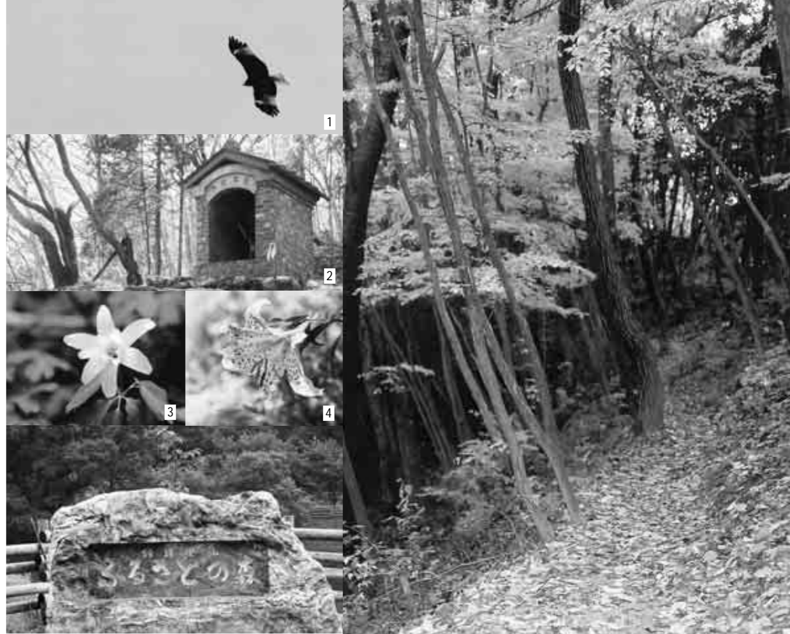
1 オオタカ 2 古峯神社 3 アズマイチゲ 4 ヤマユリ

なお、「ふるさとの森サポーター」として活動して下さるかたを募集しています。詳しくは花園産業振興課(5841125)までご連絡ください。