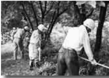
下草刈りの作業風景