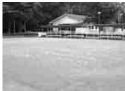
ゲートボールコート(2面)