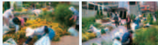
深谷駅前のガーデンもボランティアのかたが行っています。