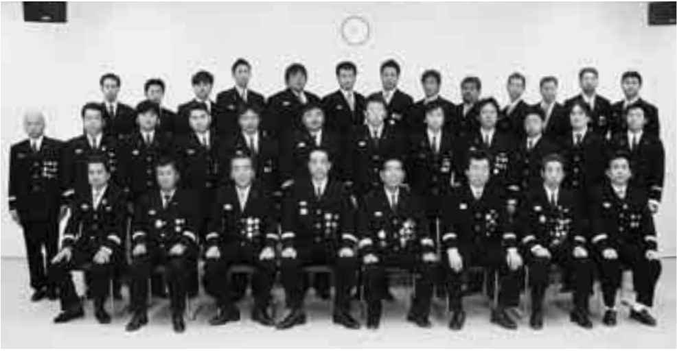
深谷市消防団役員の皆さん

「自分たちのまちは自分たちで守る」という消防精神のもとに組織されている深谷市消防団の平成18年度新役員を紹介します。