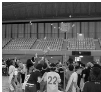
▲10月12日に開催された『第8回ふれあいスポーツ大会』の様子

スポーツ大会では747人、文化作品展では1,155人の参加があり、スポーツや文化作品展を通じて親睦を深め、障害および障害者への理解を深め親交を図りました。