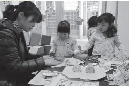
花園公民館の『子育てサロン』は原則第1・3木曜日実施

子育てボランティアの皆さんの協力によって開催される『子育てサロン』。今回は更生保護女性会も参加し、親子でひな祭りの飾りを作って盛り上がりました。