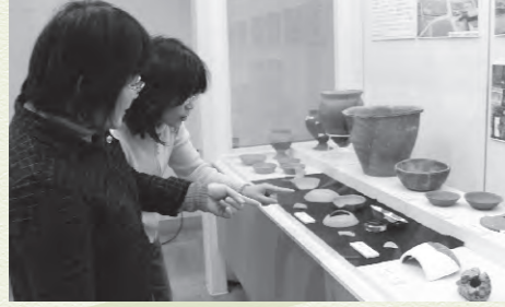
最新出土品展は8月29日(金)まで開催しています

市内には数多くの遺跡があります。今回は近年の発掘調査成果として12か所の遺跡から出土した品々が展示され、来場者は熱心に観賞していました。