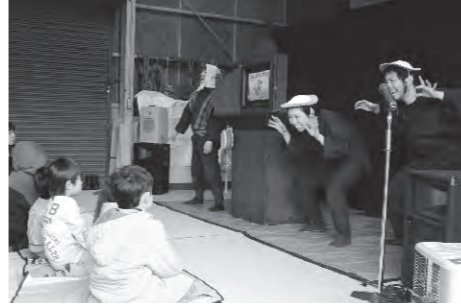
劇団お伽座の皆さん

建国5周年特別上演として『はみだし紙芝居』が登場。紙芝居から物語が抜け出して演者がかけあう様子に、子どもたちは圧倒されていました。