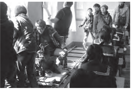
撮影されたのは主人公の回想シーン

『二層楼』の名で知られる深谷商業高校記念館(国登録有形文化財)で、宮沢りえさん主演の映画『紙の月』のロケが実施されました。