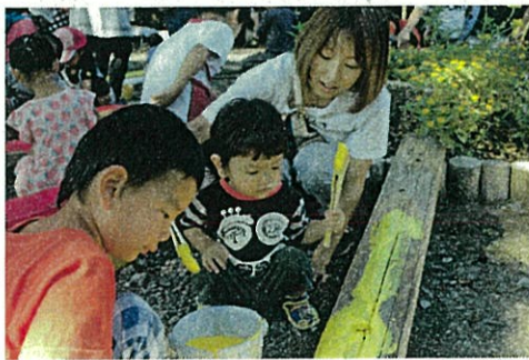
施設内修繕の一環で子どもたちが木材にペンキを塗った（8月・10月に実施）

川本サングリーンパークは、今年度から「利用者が作り上げられる体験型テーマパーク」として位置づけ、これからも愛着をもって利用してもらうための取り組みを始めました。