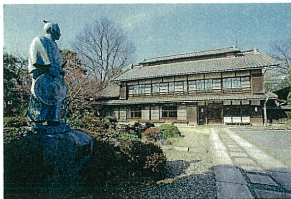
渋沢栄一 なかにち 生誕の地『中 なか の家』