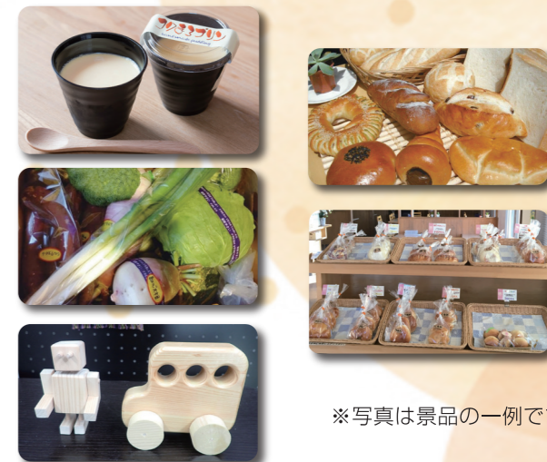
※写真は景品の一例です