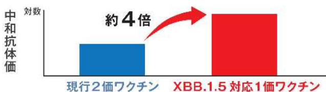
XBB.1.5 に対する中和抗体価の上昇(マウス)

現在開発中の XBB.1.5 対応1価ワクチンは、非臨床試験(マウスを用いた試験)において、XBB.1.5 に対して現行2価ワクチンよりも高い中和抗体価を誘導することが報告されています。