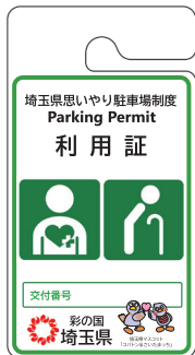
その他の高齢者、 障害者等用