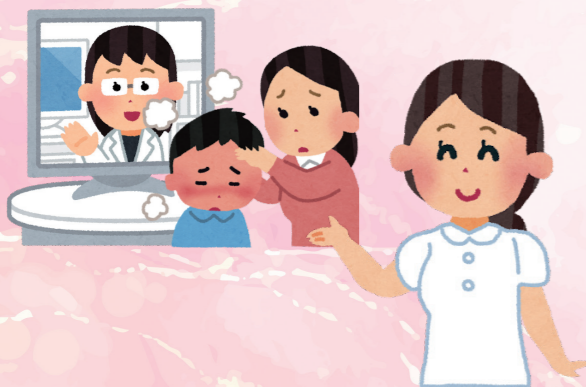
オンライン診療(調剤含む) 1,335万9千円