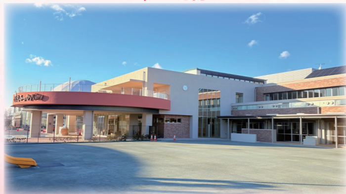
ふかや幼稚園の開園 3,303万円