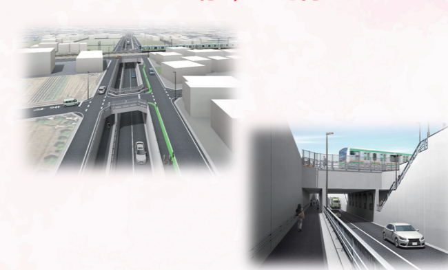
街路築造(工事)(アプローチ部) 14億1,600万円