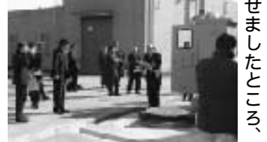
皿沼浄水場配水池緊急遮断弁

「議会あれこれ」請願ってなあに?」...国民が国または地方公共団体等の公共団体に対し、一定の措置をとるよう、あるいはとらないよう希望し、申し出る行為です。