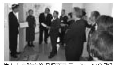
佐々木病院病後児保育ステーションのぞみ

答 平成20年度から就職相談員1名が週3日勤務しています。平成20年10月から平成21年1月までの状況は、面接件数が延べ174件のうち、就労者は9件、就労による自立者は2件となっています。なお、平成21年度は、就労相談員について、一日5時間で週5日の勤務に拡大するように予算を計上しました。