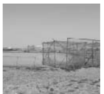
川本高校河川敷グラウンド

問 川本高校が使用している河川敷グラウンドを、市民が利用できるようにすべきでは。 答 高校が占用しているグラウンドの一部はグラウンドゴルフ場として既に使用されていますが、支障のないよう早急に対応します。野球場についても慎重に検討します。