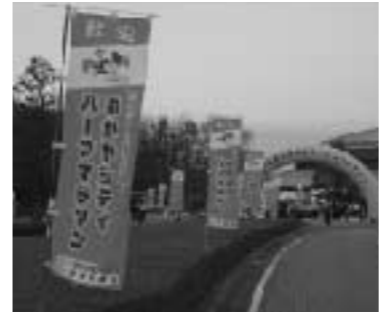
ふかやシティハーフマラソン