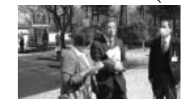
川本サングリーンパーク

答 一人当たりの健診単価が15%程度上昇したためであり、混雑緩和策として21年度より予約を午前3回、午後3回の時間単位にしてまいります。請願第17号