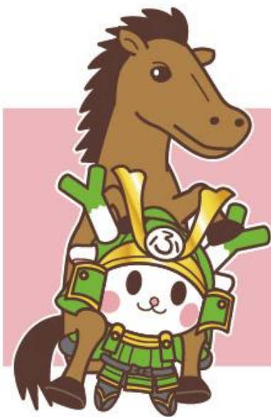
深谷市イメージキャラクター ふっかちゃん