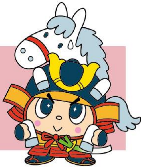
郷土の英雄 畠山重忠 埼玉・深谷市