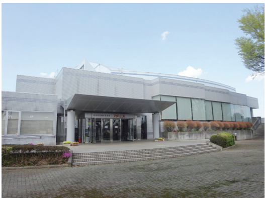
花園文化会館アドニス

Q 現在の高齢者の皆様は元気のよい方々が多い。その方々が仕事をしたいと言っている。広く高齢者の皆様に仕事を紹介したらいと思っが。 A 具体的には、深谷市ふるさとハローワークでは、キララ上柴3階において専任の相談員を設置し求人情報の提供や職業相談を行っている。