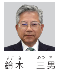
映像はこちらから