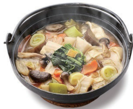
文化庁：伝統の100年フードに認定の煮ほうとう