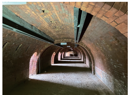
ホフマン輪窯6号窯