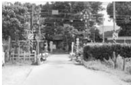
市道幹41号線（清心寺付近）

問 子どもたちの登下校の安全性を高めるため、道路整備の優先性に重点を置き、別枠での対処や制度の手直しをするべきでは。