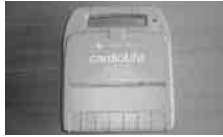
AED (自動体外式除細動器)

答 高齢者が集まる場所を優先的に考え、AEDを使用するスタッフの配置を考えています。100%救急蘇生法をマスターしたうえで順番を考えてやらせていただきます。