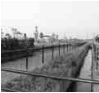
スマイルパーク東側水路