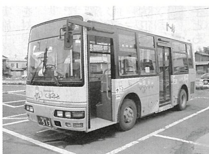
市内循環バス「くるリン」

問 保育園に通園している乳幼児が、病気やけがの回復期にあつて、まだ集団保育ができない場合、保育と看護を行って保護者の子育てと就労の両立を支援する事業である病後児保育所を設置する考えはあるか。 答 医療機関の協力が必要なため、調査をし今後の課題として検討してまいります。 問 現在深谷市では、単独事業として実施している手話通訳派遣事業において、10月から障害者自立支援法が施行するとどうなるのか。 答 1割の定率負担は徴収せず現行のサービスを維持してまいります。