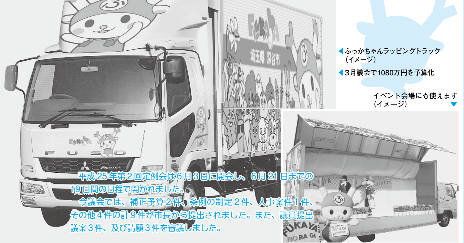
◀ふっかちゃんラッピングトラック (イメージ) ◀3月議会で1080万円を予算化