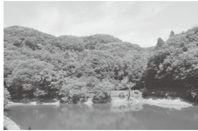
鐘撞堂山 霧ヶ谷津池

問 この事業は農業規模拡大農家の機械や施設に対し助成を行うとのことだが、対象農家数は。 答 経営体育成支援事業として人農地プランに位置付けられた875名に通知し、平成24年度の国の補正事業として11経営体、平成25年度の事業費分として34経営体を予定している。