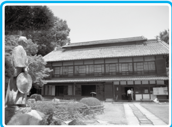
深谷栄一翁の生地(中の家)