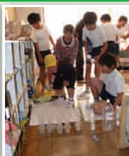
ペットボトルボウリング

【表紙の写真】 八基小学校では、青淵公園のごみ拾いを「青淵公園をキレイにする会」の方と行っています。表紙の写真は寒風の中、ごみ拾いを終えた皆さんです。また、左の写真は昨年11月に開催された「くすのき祭り」の様子です。