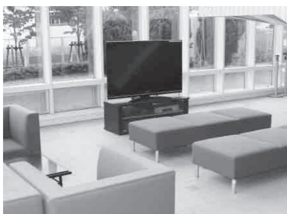
市政情報を動画で流せないか

問 広報様式も近代化するべきでは。 答 市の広報活動としては、紙媒体の「広報ふかや」以外に市ホームページやモバイルサイトの運用から情報発信を行っている。また、パソコンや携帯へのメール配信サービス、庁舎に設置してあるモニター広告やJR深谷駅前にある電光掲示板、深谷ねぎっこプロジェクトを活用し最新の情報を発信している。 問 適切、積極的な情報公開が行財政改革をけん引するものと考えているが。 答 行財政改革を推進する上で市政の情報公開が深くかわっており、広報活動の重要性は強く感じている。その上で、広報事項に関係する担当部署と協議しながら、できるだけ公開する方向で進めている。 問 各部署で行われている行政サービスや、各種お知らせについて、議会の中でも「周知徹底を図ります」等の回答が多い。さらに、市民から寄せられるご意見の中には、「お知らせが十分」や、「いつ広報されたの？」等の声は依然多い。また、苦情に発展しているケースも見受けられ、業務能力を 問 動画広報について先例市を調べると、ケーブルテレビを持っている自治体が多い。また、動画広報で使用する情報の政策経費もかかってしまう。ただし、編集作業の伴わない情報については研究していく。