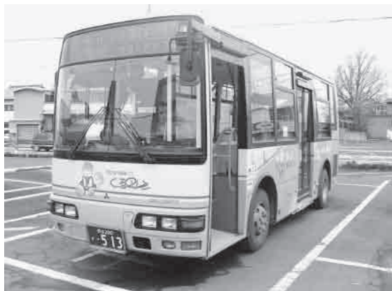
市内循環バス「くるリン」

問 利用者をもっと増やすための工夫を何か考えているのか。 答 各種イベントや広報等でPRし市民への周知をしていく。 問 現在は停留所方式だが、なぜ自宅送迎方式にできないのか。 答 あらかじめ時刻、停留所及び運行ルートを設定した「乗り合いバス」事業として運営している。また自宅送迎方式とした場合、民間タクシー事業者の活動を圧迫する恐れがある。今後、