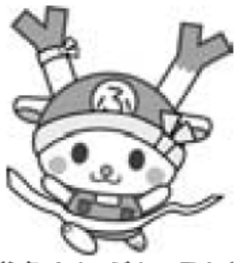
深谷市イメージキャラクター「ふっかちゃん」